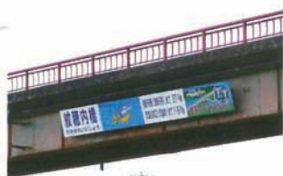
橋には距離が分かる看板も