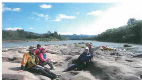
中島岩盤で記念撮影