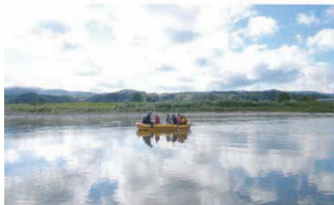
ゆるやかな流れのなか、風が気持ちよい